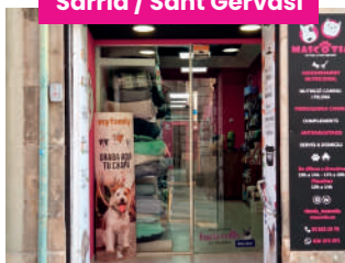
Sarrià / Sant Gervasi